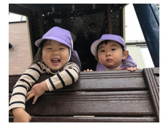
滑り台からやっほ〜！ ここでも、かくれんぼをして遊ぶこともあります！