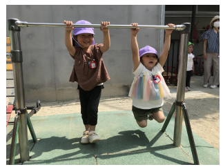
お外に出たら一番に行くくらい大好きな鉄棒♪