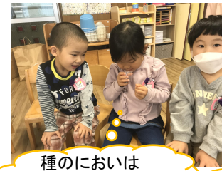
種のおいはいしないよ！