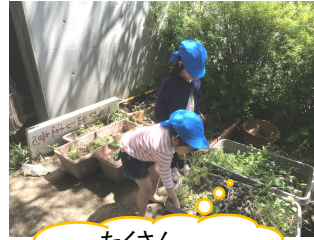
たくさん集めるぞ〜♪