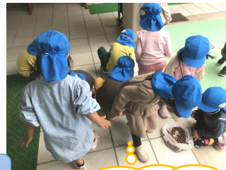
足で踏んで実を割るよ！