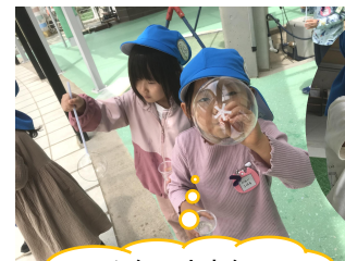
こんなに大きなシャボン玉！