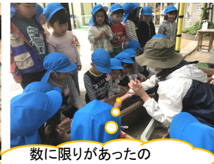
数に限りがあったので、今回は担任が植えました^^