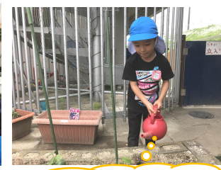
お当番さんが水やりをしています☆