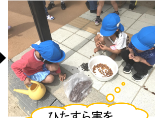
ひたすら実をむきむき...