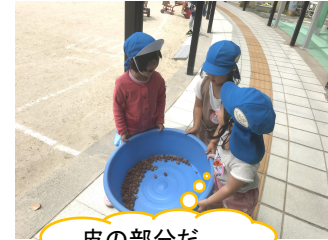
皮の部分だけを使うよ！