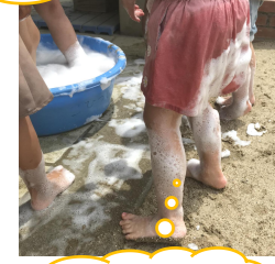
お尻も泡だらけー！