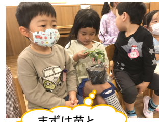
まずは苗と種の観察！

クラスでオクラと朝顔を育てます！こぼと3組は、外の三輪車置き場横のプランターと花壇で育てているので、お迎えの際はぜひ見せていただきますね♪