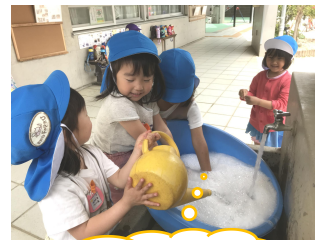
あわあわ出てきた！