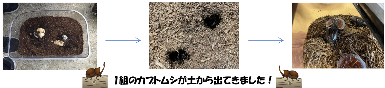
1組のカブトムシが土から出てきました！

ずっと土の中にいたカブトムシ。一匹だけ、虫かごの端にいて土の中の様子がみえていたので子どもたちも、毎日観察していました。白い幼虫から、だんだん黒くなってきたことに気付いたお友だちがみんなにお知らせ！まだかな～と待っていると、土のところに穴が！！みんなも、わくわくが止まりませんでした！休み明けに見ると2匹のカブトムシが出てきてくれていました！♡朝のご用意を忘れ、リュックサックを背負ったままずっとカブトムシに夢中でした（笑）「先にご用意しておいで～！」と伝えましたが、シールノートや、コップなどを出すたびに、カブトムシのところへ寄り道（笑）カブトムシが動くたびに、ビックニュース！のように大きな声でお知らせしてくれています♪ 虫が苦手な子も、「触ってみたい」という声です！すると、近くにいたお友だちが「こわくないで！カブトムシさん優しいよ！」と教えてくれていました。その言葉もあって、人差し指でカブトムシの背中をよよしすることができました！ お部屋の絵本棚にカブトムシの絵本があるのですが、絵本のカブトムシと1組のカブトムシを見比べたりしています。カブトムシのおうちも、どんなおうちが好きかな？とお話してみると「でっかいおうち」「きれいなおうち」とたくさん意見が出てきました。これから、みんなでカブトムシのおうちをつくれたらなあと思っています！最近の1組のみんなは、毎日カブトムシを見てから遊び始めることが多いくらい興味を持って来ています♡♡