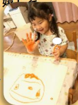
「まゆげになった」 の手遊び

人数が増えるという環境の変化は、「絵本読んで〜！」「給食食べるのお手伝いして〜！」「抱っこして〜！」などの、日々の子どものたくさんの声に、保育者3人でもすぐに応じられず、待つことや、自分で何とか気持ちの折り合いをつけること、どうしたらいいのか考えることなどの機会が増えてきていると思います。マイナスに捉えてしまうより、その中でこそ育ちをより良いものにしていきたいと思っています。また、これからもお気付きの事や、ご心配などありましたら、いつでもお声がけください。一人ひとりをしっかりと受けとめながら、安心して過ごしていけるように心掛けていきたいと思っています。