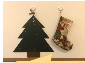
アドベントカレンダー