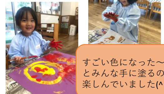
すごい色になった〜！とみんな手に塗るのを楽しんでいました( ^_^ )