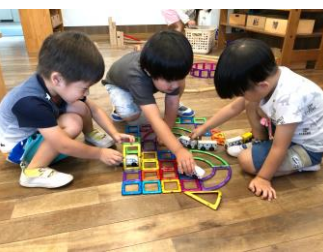
マグフォーマーで作った線路！