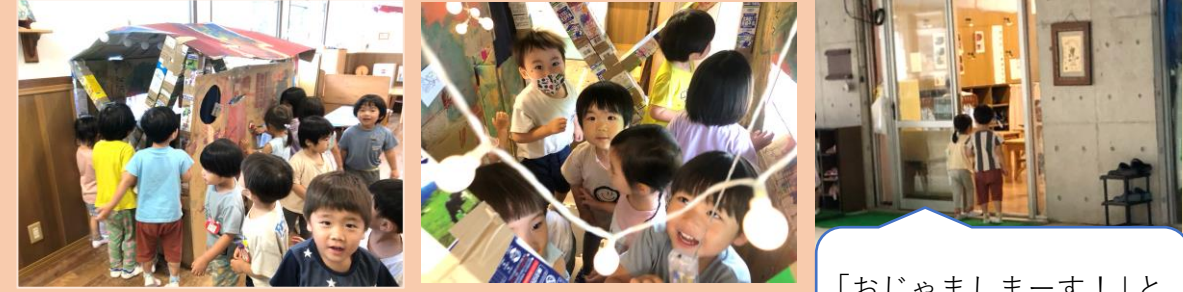
「おじゃましまーす！」と挨拶もバッチリ☆

こうさぎ組でクラス交流の時間が持たれました。初めて行くお部屋に緊張気味で、はじめは私から離れようとしなかった子ども達。1組のお部屋におじゃますると、大きな段ボールハウスを見つけて大はしゃぎでした！その後も朝の自由遊びの時間には自由に行き来が可能で、朝のご用意を済ませると、お友達と手を繋いであちらこちらのお部屋へ嬉しそうに遊びに行く姿があります( ^_^ )