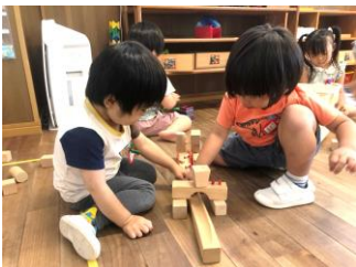
お友達とかわりばんこでビー玉転がし♪