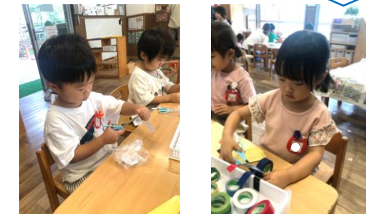
ビニールテープも自分で切れた！