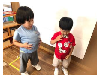
新聞紙遊び 新聞をパンチして破いたりお皿に乗せておまごをして遊んだよ！最後はおなかパンパンに(笑)