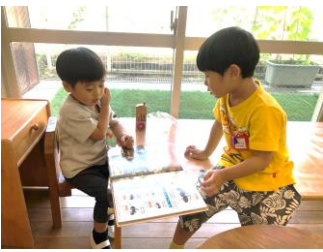
お家から持ってきたセミの抜けがらを手に 図鑑で研究中...