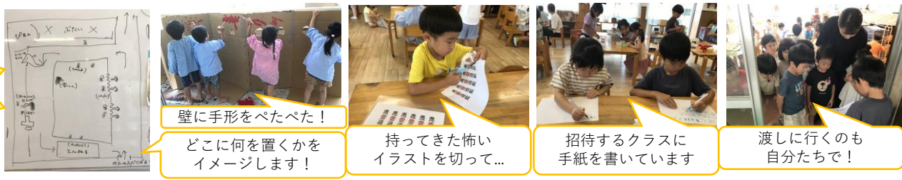
壁に手形をぺたぺた!