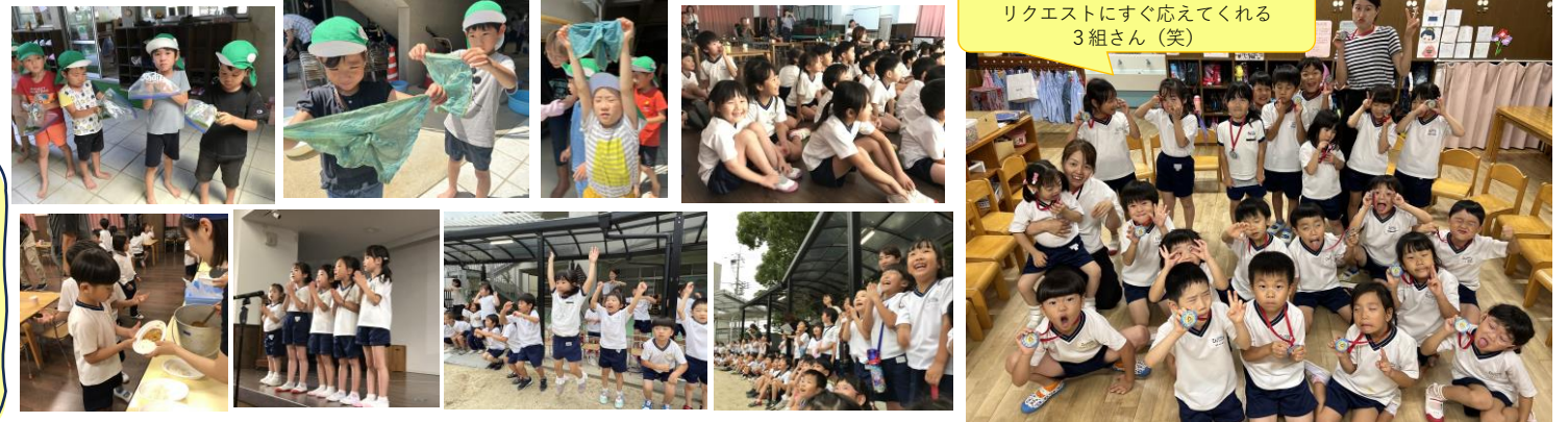
「面白い顔して～！」とのリクエストにすぐ応えてくれる3組さん(笑)

待ちに待ったデイキャンプの日！天候が心配されていましたが、クラスの子が作って持ってきてくれたてるてる坊主のおかげで、最後まで予定通り行うことができました。藍染め、キャンプファイヤー、花火など、盛りだくさんの一日でしたが、子どもたちは帰るまずっと元気いっぱいでした♪今年子どもたちにも係活動してもらいましたが、それぞれが自分の役割をきちんと理解し、行動する姿はさすがこひつじさん！完成した藍染めのランチマットも、一人ひとり違う模様になり上がり、本当に素敵でした。完成したランチマットをみんなの前で一人ずつ紹介してから返すと、「いいやん！」「きれい～」「おお～」「〇〇みたい！」と嬉しい反応をしてくれた子どもたち。こうして自然とお互いを認め合うことができるって、めちゃくちゃ素敵!!!と感動していた担任でした♡後日、早速藍染めのランチマットを持ってきて、嬉しそうに使う子どもたちの姿は本当に微笑ましかったです。残念ながら当日は欠席のお友だちがいましたが、「キャンプの日は全員揃ってほしい！」という子どもたちの願いが日々ひしひしと伝わってきて、それもまた嬉しいひと時でした。子どもたちにとって、今回のデイキャンプが素敵な思い出として心に残ってくれたらと思います。