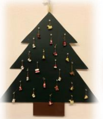
アドベントカレンダー