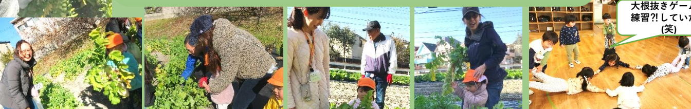
大根抜きゲームで練習?! していたよ(笑)

大根抜き へのご参加、ありがとうございました。最初は、本当に小さな小さな種だったのに、芽が出てきてくれて、葉っぱがぐんぐんと成長していく様子は、時々子ども達と畑に行くたびに驚かされ、不思議な気持ちも味わいながら、収穫の時を待っていました。お家の方との楽しいひと時にもなったなら本当に嬉しいです。日々のお世話をして下さった用務の方にも、自然の恵みにも感謝の気持ちを忘れずに、これからも子ども達に伝えていきたいと思っています。