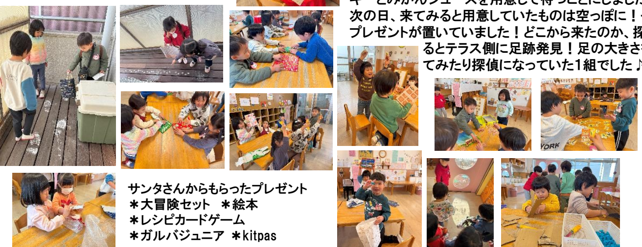
サンタさんからもらったプレゼント *大冒険セット *絵本 *レシピカードゲーム *ガルバジュニア *kitpas

帰りの絵本を読んでいると、絵本の中から1枚の手紙が...読んでみると、サンタクロースからの手紙でした。大好きなみんなにプレゼントを持っていくねと書かれていました。みんなで話し合い、いつ来てもいいように、クッキーとみかんジュースを用意して待つことにしました。次の日、来てみると用意していたものは空っぽに！そして、プレゼントが置いていました！どこから来たのか、探してみるとテラス側に足跡発見！足の大きさを比べてみたり探偵になっていた1組でした！