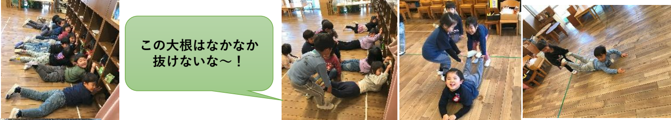
この大根はなかなか抜けないな〜！

本当の大根抜きでは、ゲーム以上の抜きにくさや重さにビックリしていました。「重たい〜！」と抱きかかえながら、土や葉っぱの匂いも感じながら、大興奮で収穫の喜びを味わえたようでした。早速、お家でもお料理して下さいありがとうございます。自然の恵みとお世話をしてくださった方々への感謝の気持ちも、日々のお祈りの中で大切にしていきたいと思ひます。