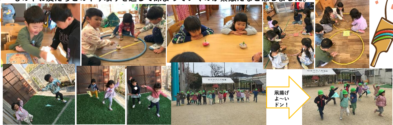
凧揚げよーいドン！

お正月遊び 日本の伝承遊びとして、ふくわらい、こま回し、凧揚げ、カルタ、お手玉遊びなどをしていました。“こま”には自分で模様を描いて、さあ！回してみよう！最初はコツがつかめなくても、お友だちの様子を見ながら直ぐにつかめる姿、何回もチャレンジして頑張る姿、クルクルと回るのをうっとり眺める姿もあり、シンプルなのに様々な楽しみ方が見られました。全て完成されているものではなく、工夫や創作の余地があるものやお友だちとのやり取りを通して深まっていくのが素敵だなと感じました。