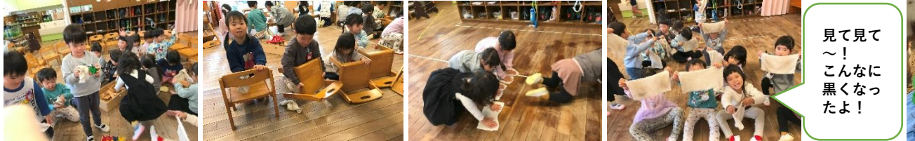
見て見て〜！こんなに黒くなったよ！

お部屋の前のウッドデッキは、まだこうさぎ3組ではお掃除したことがないのですが、いつもこうさぎ4組さんや他の先生が拭き掃除をしてくれている事をお話ししたいと思っています。そして自分のお部屋の身近な所から、他の場所へも視野を広げて考えていくきっかけになると良いな...2月からは3組さんの活躍の場も広がると良いな...と考えています。