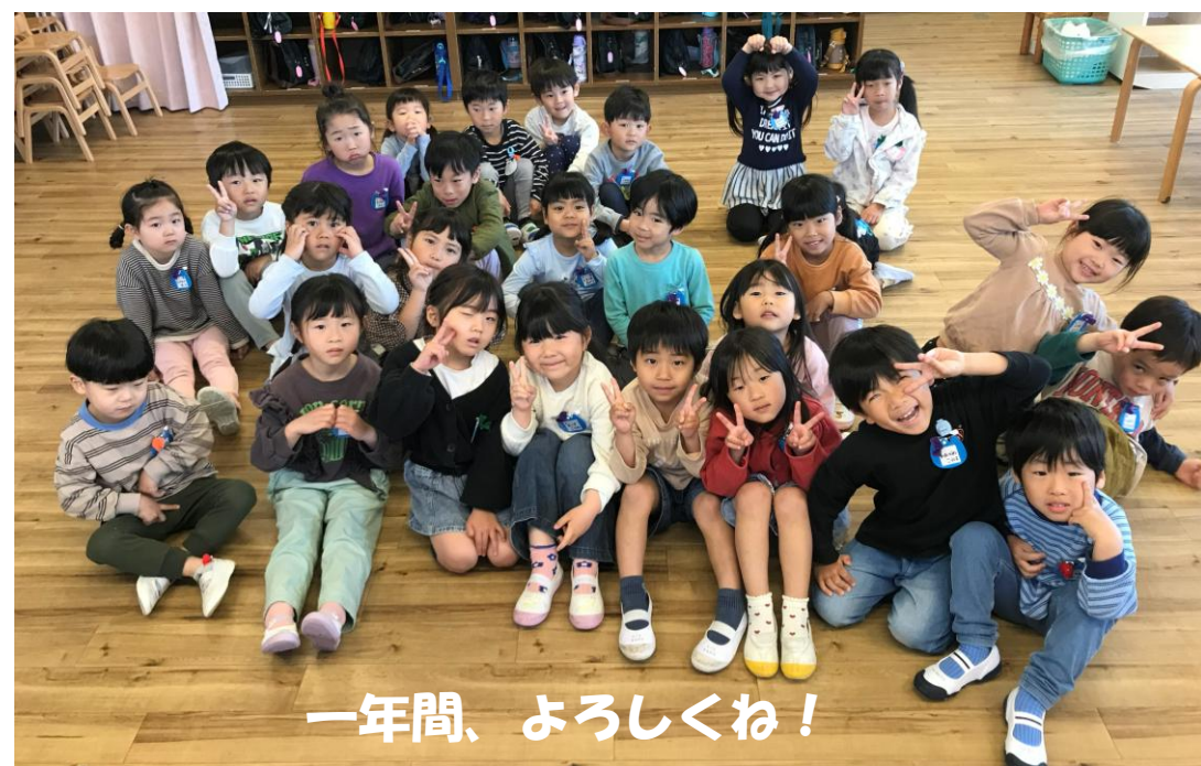
一年間、よろしくね！

緊張の中でスタートしたこひつじ2組の子どもたち！自由遊びの中では今まで関わったことのある子との関わりが多くなりますが、スライムコーナーを作ると「やってみたいな・・・」とやってきて、触り始めました。伸びたり丸まったり手にくっいたりしているうちに会話がはずんで、笑い声が起り少しずつ緊張もほぐれてきている様子です。また「なべなべそこぬけ」や「しっぽとり」「椅子座りゲーム」などの集団遊びも大好きで、「なべなべそこぬけ」は子ども同士ですと最初は絡まっていたのですが、だんだんコツを掴み全員でも成功するようになり、飛び上がって喜んでいました。「しっぽとり」や「椅子座りゲーム」も最初は様子を見ていたお友達もいましたが、おもしろそな雰囲気に参加し始めました。もうすぐ親子ピクニックがあります。保護者の方と一緒に過ごせることを楽しみにしている子どもたちです。いろいろな活動の中で少しずつ緊張が和らいでいくといいな・・・と思っています。